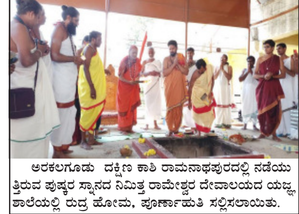
ಅರಕಲಗೂಡು ದಕ್ಷಿಣ ಕಾಶಿ ರಾಮನಾಥಪುರದಲ್ಲಿ ನಡೆಯುತ್ತಿರುವ ಪುಷ್ಕರ ಸ್ನಾನದ ನಿಮಿತ್ತ ರಾಮೇಶ್ವರ ದೇವಾಲಯದ ಯಜ್ಞ ಶಾಲೆಯಲ್ಲಿ ರುದ್ರ ಹೋಮ, ಪೂರ್ಣಾಹುತಿ ಸಲ್ಲಿಸಲಾಯಿತು.